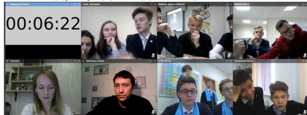
Тюмень – Павлодар (Казахстан), ноябрь 2017.