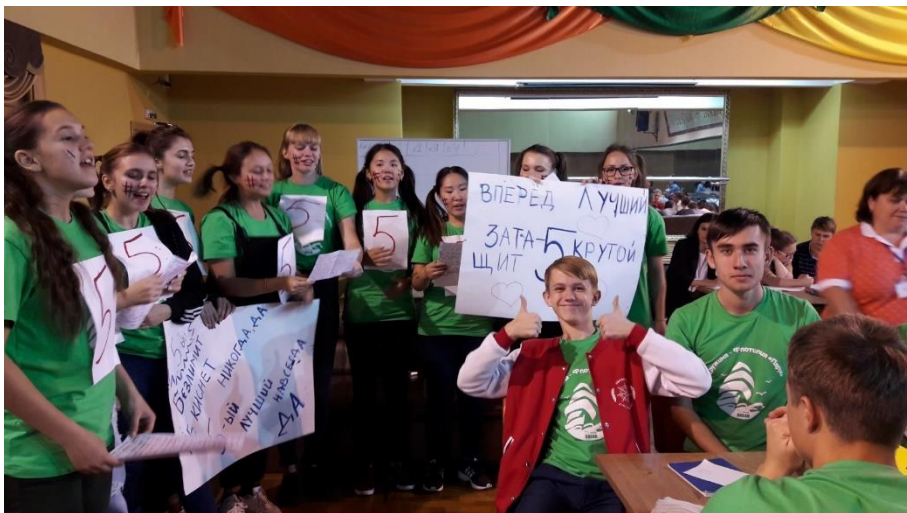
Дальневосточный чемпионат креатив-боев Федеральный лагерь «ОКЕАН»