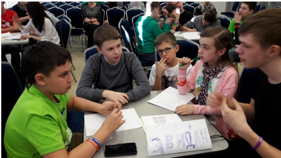
Креатив- бой на «Робофесте-2018».