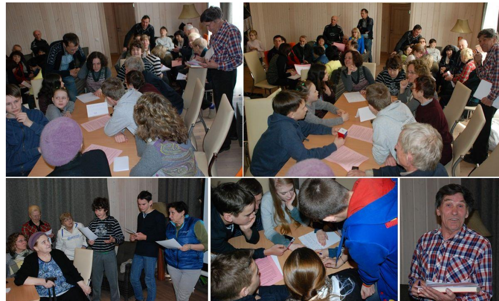
Пос. Коробицыно (Лен. Обл.), апрель 2016.